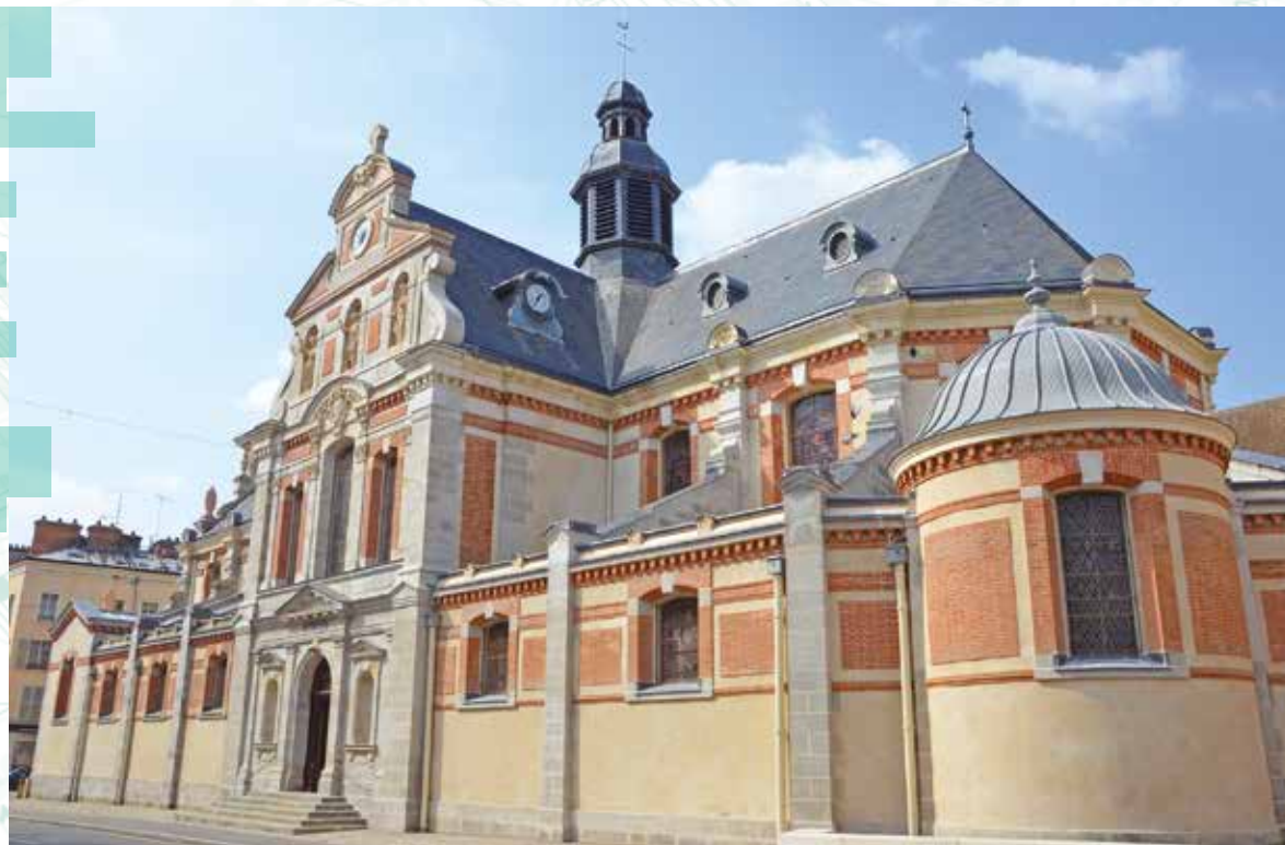
La totalité de l'extérieur de l'église Saint-Louis a été entièrement rénovée.

— Fontainebleau Le Mag communique régulièrement sur les chantiers majeurs entrepris en Ville. Rénovation, construction... Fontainebleau se modernise et améliore la qualité de ses services.