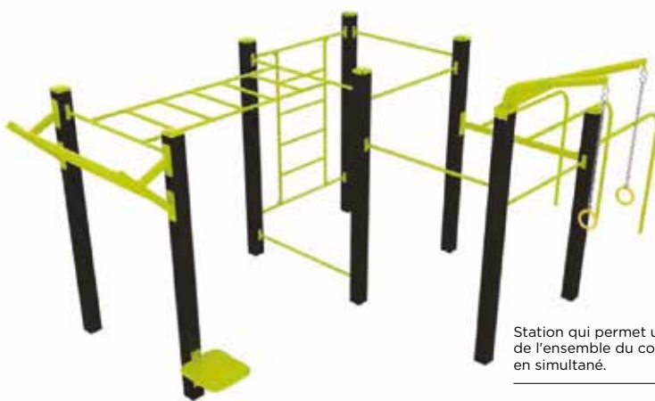
Station qui permet un entraînement de l'ensemble du corps, jusqu'à 11 personnes en simultané.

Le Street Workout, littéralement entraînement de rue , est un mélange de gymnastique et de musculation. Une application mobile, accessible gratuitement, sera téléchargeable pour optimiser vos séances, libres ou encadrées, sur cette