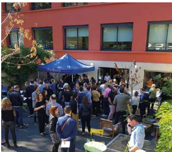
4 ans du Stop and work : ça se fête !

du site. La société met d'ailleurs un point d'honneur à favoriser les échanges, et organise notamment un événement mensuel pendant lequel ses 350 stop-workeurs peuvent alors prendre le temps de se rencontrer.