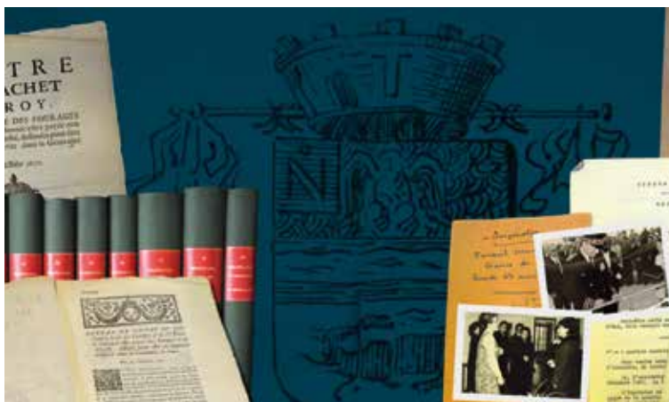
La richesse des archives municipales.

L'occasion de découvrir quelques trésors, comme les actes royaux délivrés à la Ville de Fontainebleau, ou les finances et l'administration communale relatant la