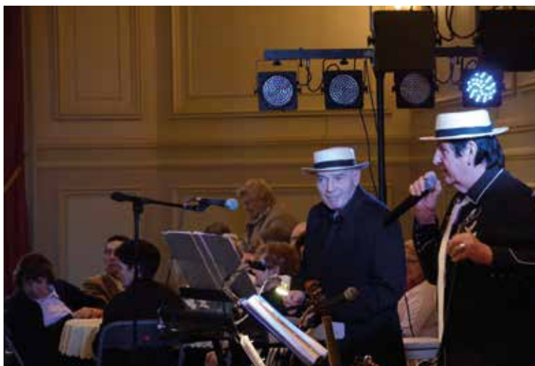
Elus et aînés partagent un moment musical animé par Les Seniors.