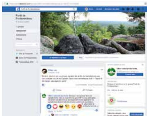
Le nouveau groupe créé sur Facebook.

Le lien du groupe : https://www.facebook.com/groups/1889115478063384