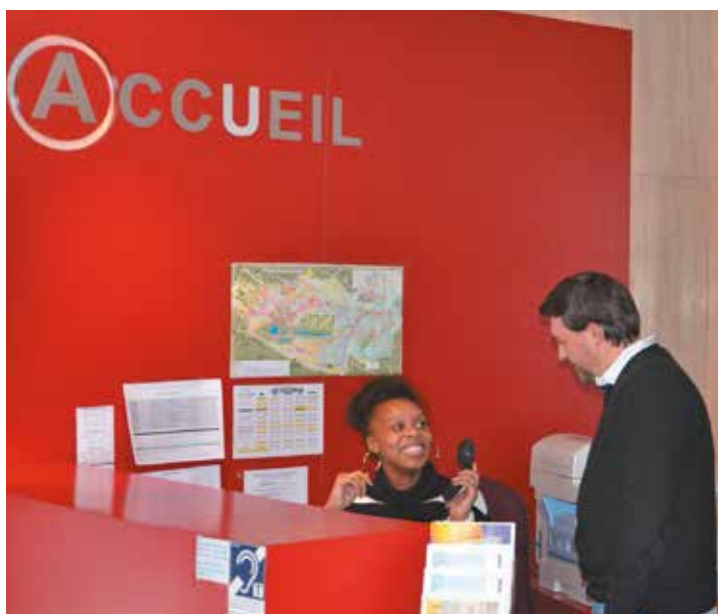
Accueil actuel de la mairie.

les démarches en ligne, adjoindre un accompagnement plus global aux services proposés actuellement (aide pour remplir certains formulaires, conseils pour accompagner les Bellifontains dans des démarches institutionnelles...).