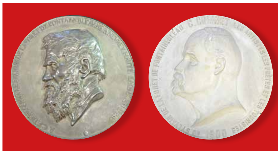
A gauche : médaille en argent représentant Denecourt, réalisée par Carrier-Belleuse en 1870 suite à une souscription publique, léguée à la bibliothèque de la Ville de Fontainebleau par Denecourt.