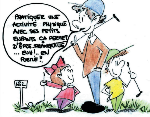
Illustration : Maëlle Granger-Cagna.