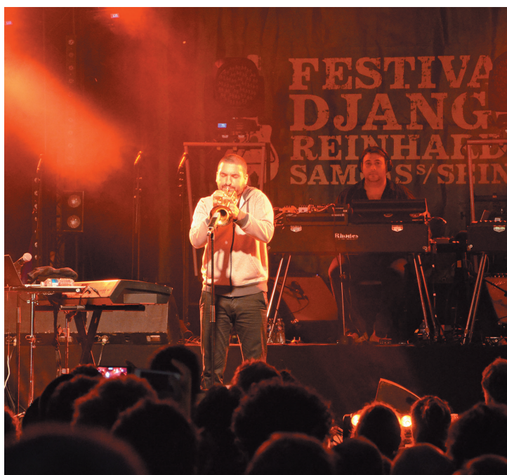
De l'énergie et du talent : Ibrahim Maalouf, « le petit prince de la trompette » lors de l'édition 2016.