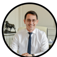
JULIEN GONDARD Maire de Fontainebleau

Aussi, 7 Bellifontains seront mis à l'honneur lors de la cérémonie, pendant laquelle ils recevront une médaille d'honneur. La Ville de Fontainebleau est fière de valoriser la générosité et les initiatives des Bellifontains qui, toute l'année, ont prouvé leur investissement auprès de la population ou dans la mise en valeur du territoire.